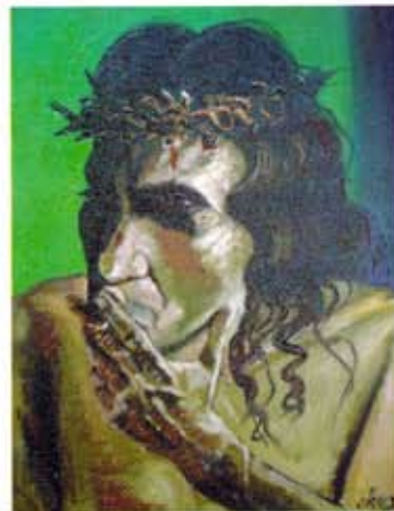
El último cigarrillo / Óleo / 30 x25 cm.

Inauguración/Cóctel: Viernes 18 de noviembre 20:30 hrs. Ex Convento el Carmen Sala 4